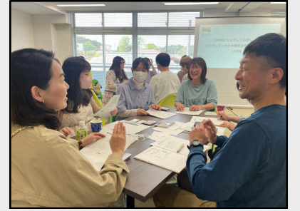
第2回定例富谷塾のワークショップ

塾生の想いが生まれる源は「喜び」や「感謝」などのポジティブなものから、「不足感」や「不満」といったネガティブなものまで様々ですが、塾生ひとりひとりの行動から少しずつ良いものが増えたり、ないものが生まれたりすることで、「富谷」がどんどんおもしろい魅力的なまちになっていくと思います。塾生の今後のチャレンジが楽しみです。